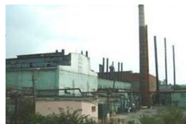
Рис. 3 Стекольный завод, г. Никольск

Продолжается экскурсия в музей стекла и хрусталя, в котором находятся вещи, помнящие Толстого, а также экспонаты, посвященные великому писателю.