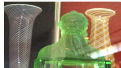
Рис. 4. Бюст Л.Н.Толстого. 1914 г.

Например, хрустальный бюст Толстого (рис. 4), который отлили в 1914 году рабочие завода по модели художницы А.Я. Якобсон.