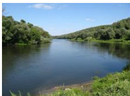
Рис. 1. Село Ильмино